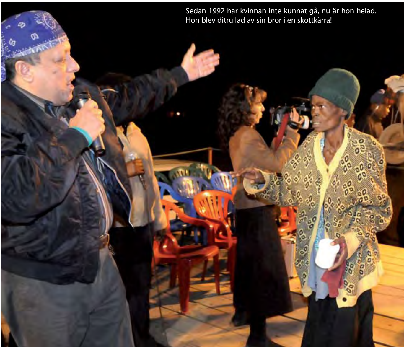
Sedan 1992 har kvinnan inte kunnat gå, nu är hon helad. Hon blev ditrullad av sin bror i en skottkärra!