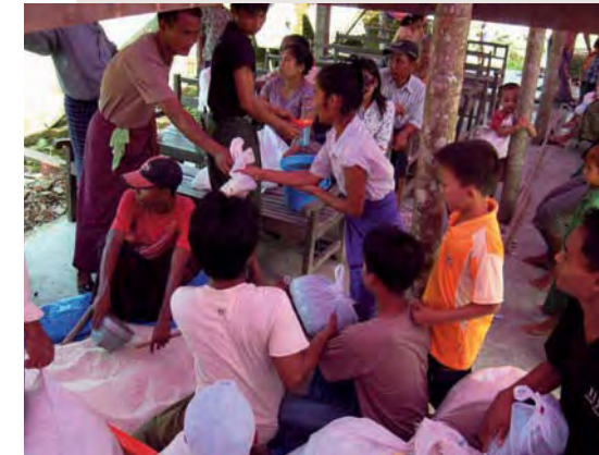
Utdelning av mat till behövande.