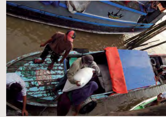
En båt lastas med förnödenheter.