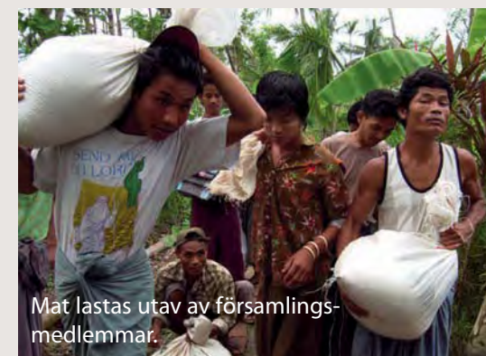
Mat lastas ut av församlingsmedlemmar.