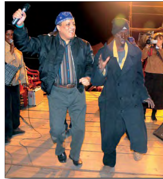
En tidigare lam man springer och hoppar.

Efter frälsningsinbjudan där skaror av människor tog emot Jesus, blev tusentals döpta med den Helige Ande och med eld