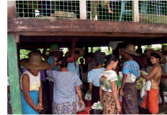
Människor har samlats i hopp om hjälp.

Fyra team skickades ut till de områden som drabbats av orkanen. Våra team reste med båt, gav medicinsk hjälp, mat, kläder och skor till de behövande. Människorna i dessa områden nåddes även med evangeliet. Ett stort tack för ert givande!