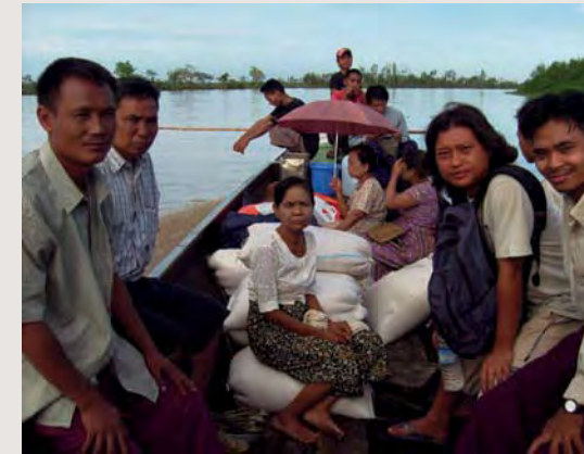
Ett av våra team på väg ut i buschen.