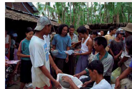
En annan av våra utdelningsplatser.