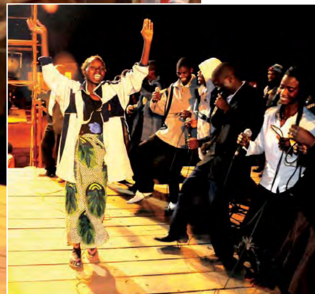
Kvinnan var tidigare förlamad, nu springer hon under glädjerop.