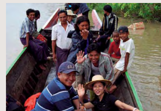
Ännu ett av våra team på väg ut i buschen.