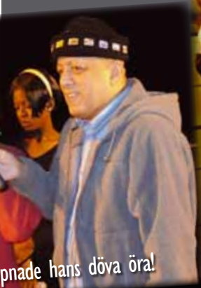
...pnade hans döva öra!