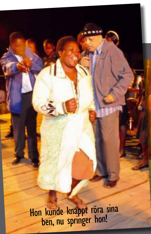
Hon kunde knappt röra sina ben, nu springer hon!

Givande kan göras via Hemsidan www.pentecostalfire.com eller via Plusgiro 491 55 44-3