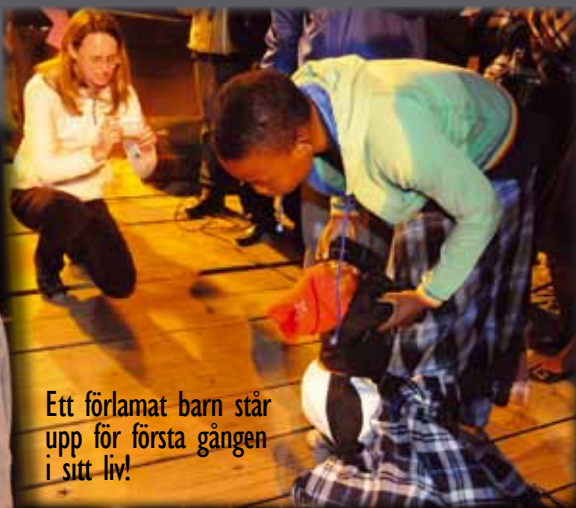
Ett förlamat barn står upp för första gången i sitt liv!