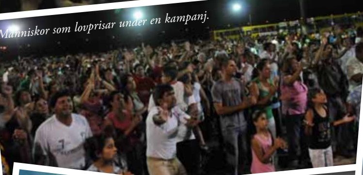
Människor som lovprisar under en kampanj.