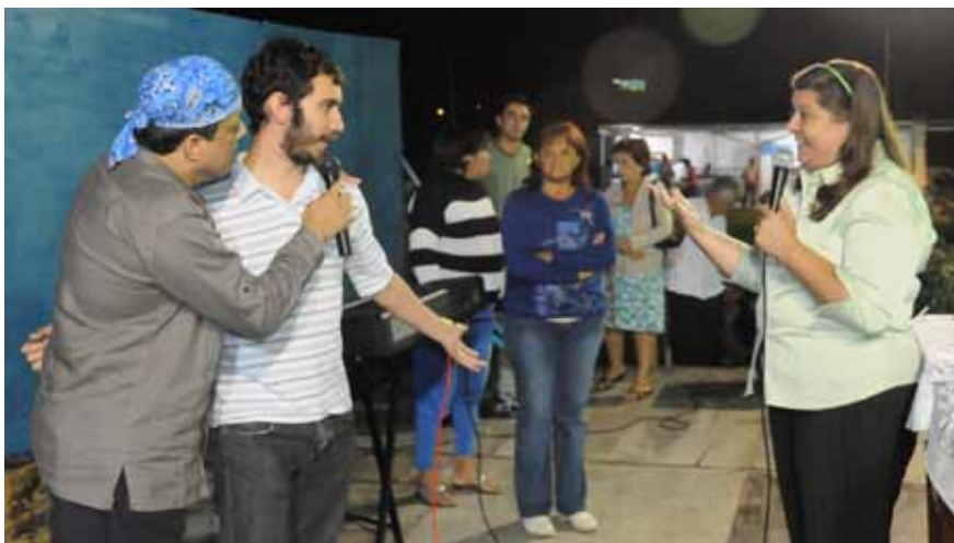
En man med grava talsvårigheter blev helad.