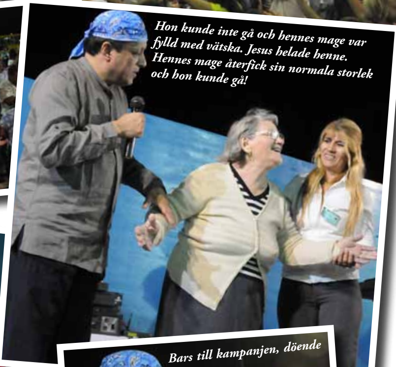
Hon kunde inte gå och hennes mage var fylld med vätska. Jesus belade henne. Hennes mage återfick sin normala storlek och hon kunde gå!