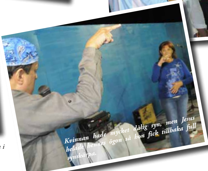
Kvinnan hade mycket dålig syn, men Jesus belade hennes ögon så hon fick tillbaka full synskärpa.