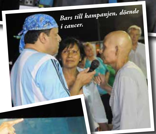
Bars till kampanjen, döende i cancer.