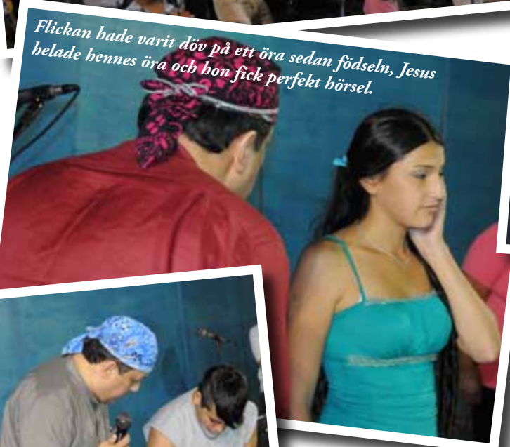
Flickan hade varit döv på ett öra sedan födseln, Jesus belade hennes öra och hon fick perfekt hörsel.