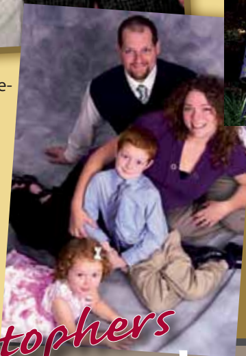
Elaine med familj.