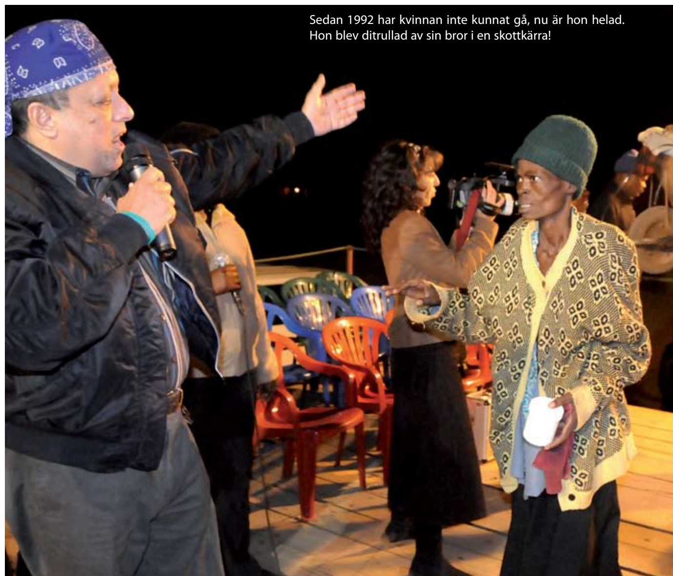
Sedan 1992 har kvinnan inte kunnat gå, nu är hon helad. Hon blev ditrullad av sin bror i en skottkärra!