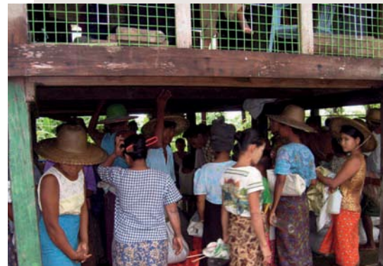
Människor har samlats i hopp om hjälp.

Fyra team skickades ut till de områden som drabbats av orkanen. Våra team reste med båt, gav medicinsk hjälp, mat, kläder och skor till de behövande. Människorna i dessa områden nåddes även med evangeliet. Ett stor tack för ert givande!