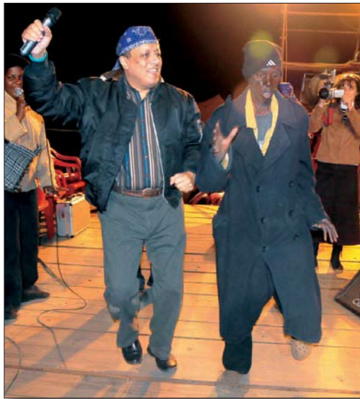
En tidigare lam man springer och hoppar.

Efter frälsningsinbjudan där skaror av människor tog emot Jesus, blev tusentals döpta med den Helige Ande och med eld