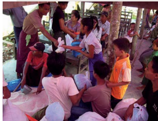
Utdelning av mat till behövande.