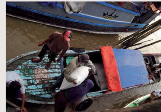
En båt lastas med förnödenheter.