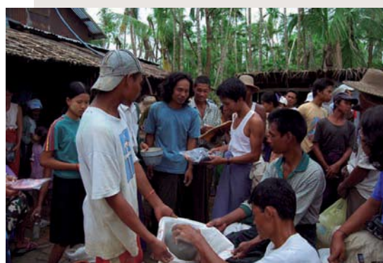
En annan av våra utdelningsplatser.