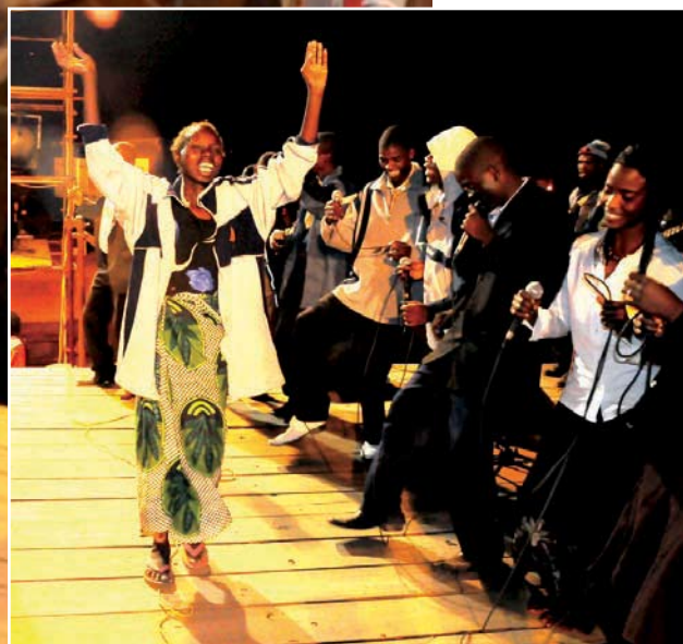
Kvinnan var tidigare förlamad, nu springer hon under glädjerop.