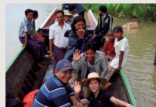
Ännu ett av våra team på väg ut i buschen.