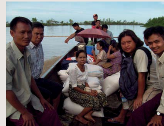
Ett av våra team på väg ut i buschen.