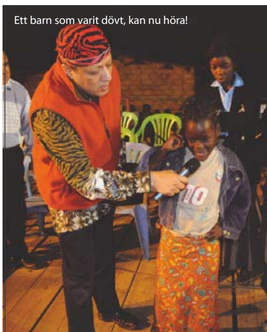
Ett barn som varit dövt, kan nu höra!

Prisad vare Herren! Jag fröjdar mig i Herren! Han har gjort stora ting! Kvällens kampanj var häftig. Folkmassorna ökade och massvis med människor blev frälsta, till Herrens