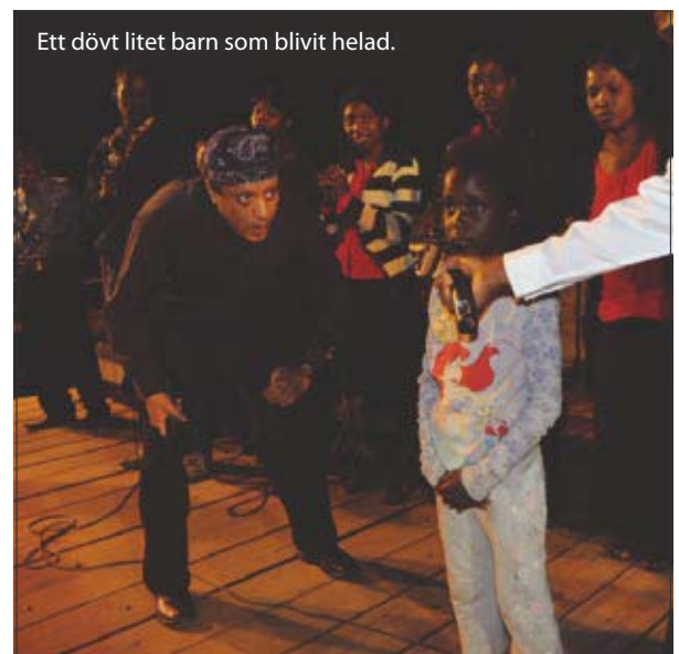
Ett dövt litet barn som blivit helad.