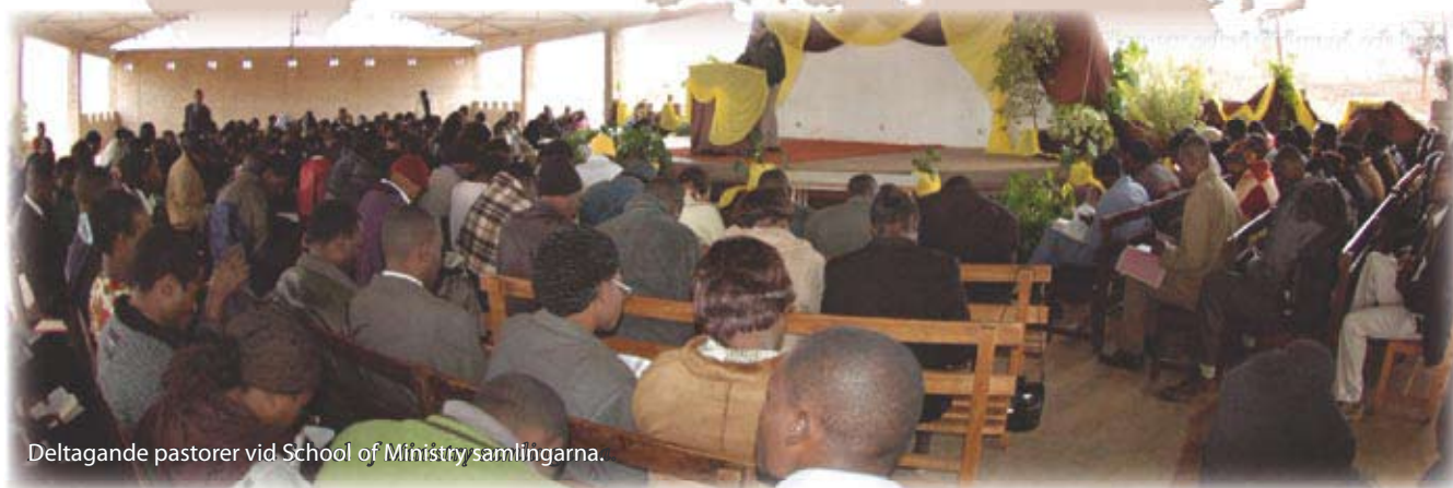
Deltagande pastorer vid School of Ministry samlingarna.