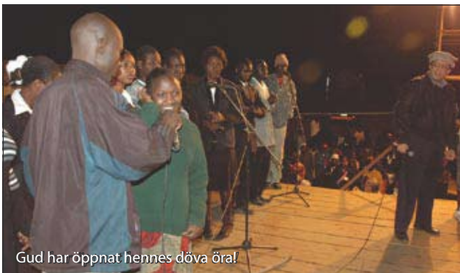
Gud har öppnat hennes döva öra!

En intressant detalj var att minst nio pastorer som var närvarande under konferensen kom fram till mig och berättade att de hade blivit frälsta på