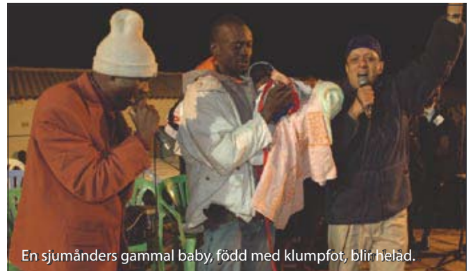
En sju månaders gammal baby, född med klumpfot, blir helad.