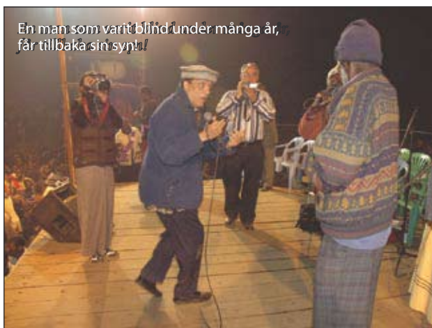
En man som varit blind under många år, får tillbaka sin syn!!