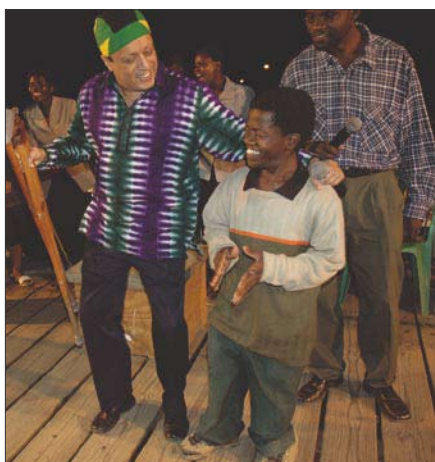
Mannen kunde tidigare inte gå utan kryckor!

Den sista kampanjkvällen föll den helige ande med sådan explosiv kraft att tusentals blev döpta med den helige ande och med eld. När den helige ande föll över oss, föll stora delar av det samlade människohavet omkull på marken som om en stor hand hade svept över fältet och slagit omkull dem. Folket brast ut i tungomålstalande, de grät och ropade. Framför scenen såg jag unga människor ligga i en stor hög, skakande, gråtande och bedjande i tungotal. Pingstelden kom ner från