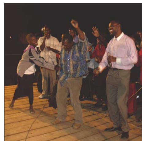
Mannen hade varit förlamad i 30 år!