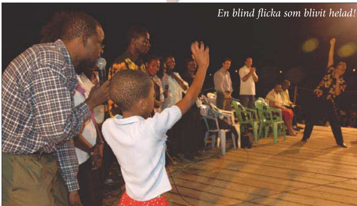
En blind flicka som blivit helad!