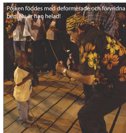
Pojken föddes med deformerade och förvridna ben. Nu är han helad!