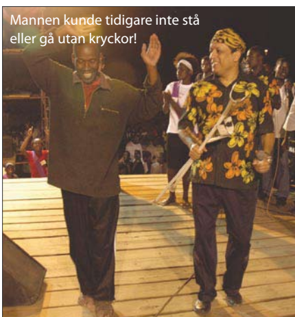
Mannen kunde tidigare inte stå eller gå utan kryckor!