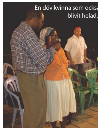
En döv kvinna som också blivit helad.