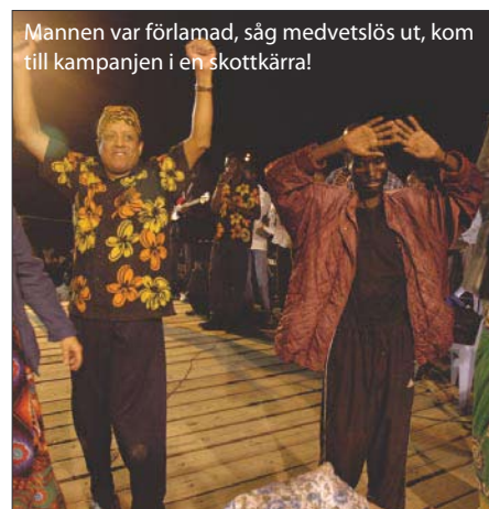
Mannen var förlamad, såg medvetlös ut, kom till kampanjen i en skottkärra!