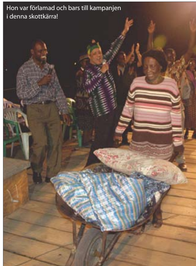
Hon var förlamad och bars till kampanjen i denna skottkärra!