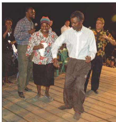
Mannen var förlamad och bars till kampanjen. Nu dansar han av glädje tillsammans med sin hustru!